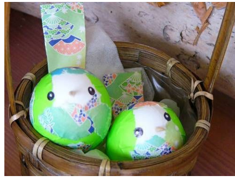
米子の手づくり展示に刺激され、卵細工のウグイスを作成しました。