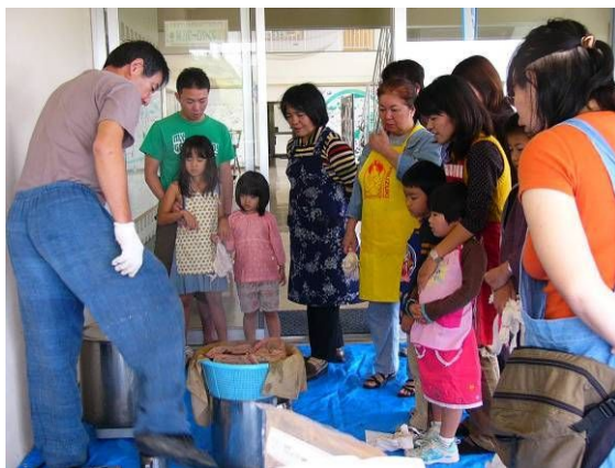
どんな色に染まるかな？

次は、テラスに移動し、マングローブの煮汁に異なる3つの媒染剤を入れ、それぞれの袋を投入！子ども達が、交代でかき混ぜてくれ、いよいよ取り出しです。さ～て！どんな作品になったか…ワクワクして、袋を広げると…思い思いの素敵なマイバックが完成！