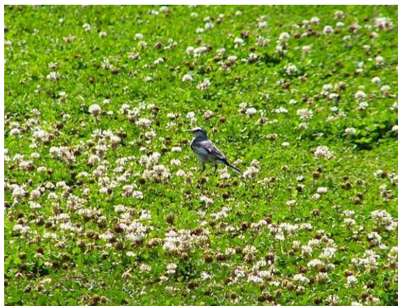
センター前の草地で食事中的のハクセキレイ♪