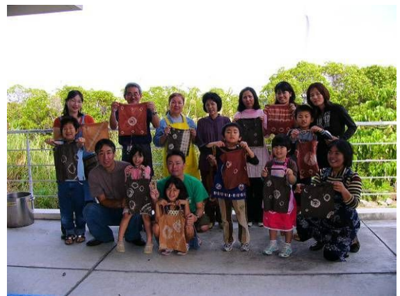
完成作品と参加者の皆さん