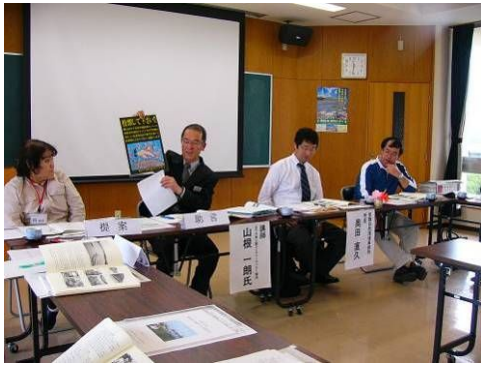
山根館長様から、様々な具体的な事例を紹介して頂きました。