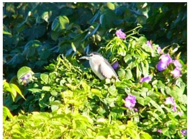
アサガオとゴイサギ…夕方の1コマ。