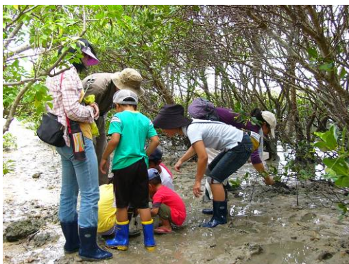
マングローブや石の下に 隠れているカニを観察!!