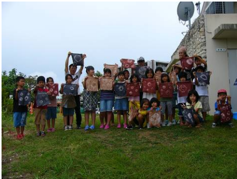
完成作品と記念撮影!!