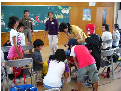
カニ講座のためにセンター内に やって来た?! オカガニを観察!!