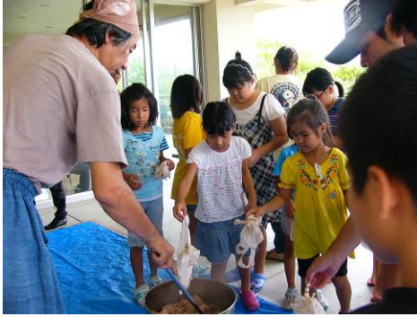
さあ!! マングローブの液に投入!!