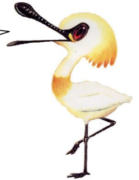
クロツラヘラサギ のクロン君