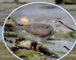
キアシシギ 7月～翌年5月