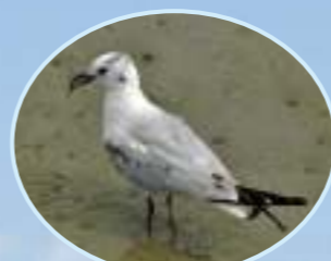
スグロカモメ 11月～翌年2月