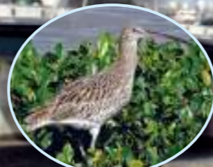
ダイシャクシギ 10月～翌年4月