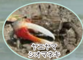
ヤエヤマ シオマネキ