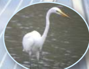
ダイサギ 9月～翌年5月