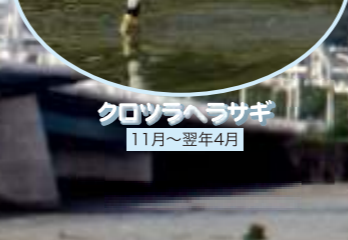
クロツラヘラサギ 11月～翌年4月