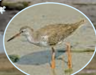
アカアシシギ 9月～翌年5月