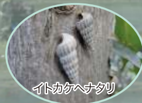
イトカケヘナタリ