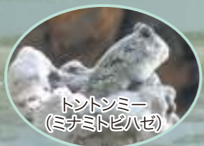
トントシミー (ミナミトビハゼ)