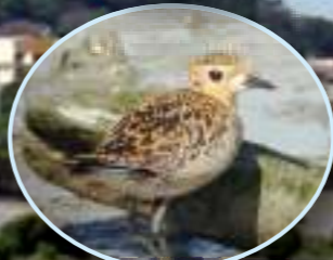
ムナグロ 8月～翌年5月