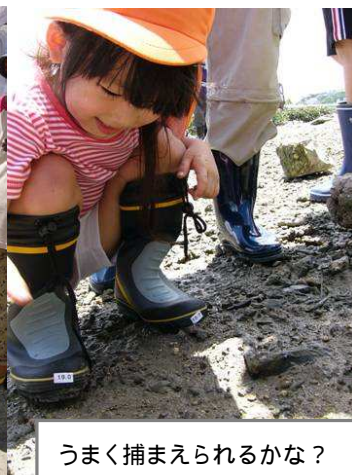
うまく捕まえられるかな？