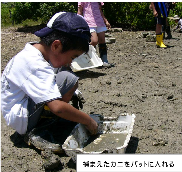
捕まえたカニをバットに入れる