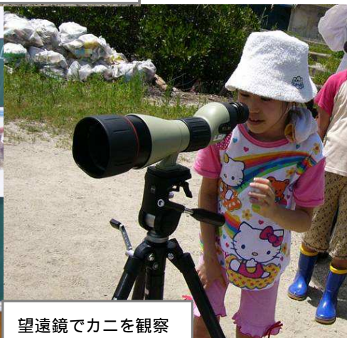
望遠鏡でカニを観察