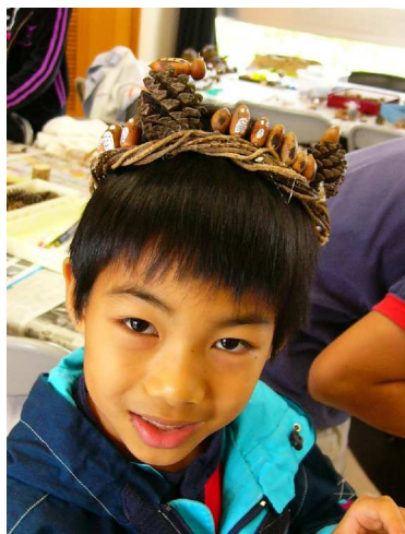
トトロの冠!! かっこいい!!