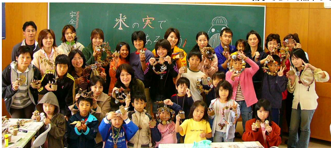
2時間でステキな作品が完成しました!!