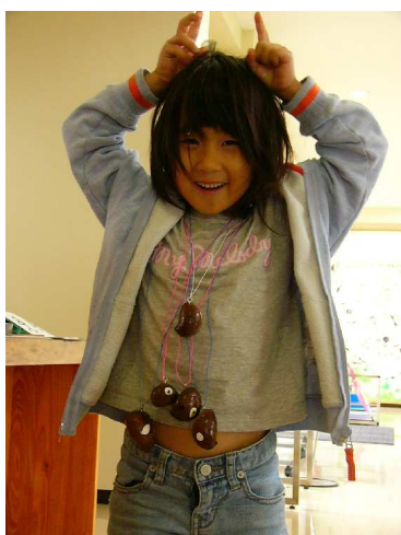
ウルトラマンネックレス、いっぱいできたね。