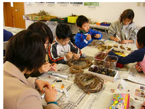
親子そろって熱中しています。