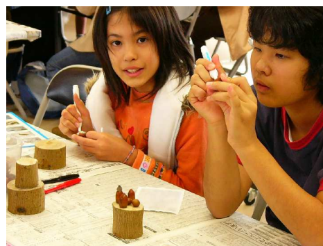
ドングリトトロをつくります。

木の実を使いながらのものづくり、とても楽しい時間が過ごせました。参加したみなさん、今度は拾うところから挑戦してみてくださいね。もっとおもしろいアイデアが浮かんでくるかもしれません。