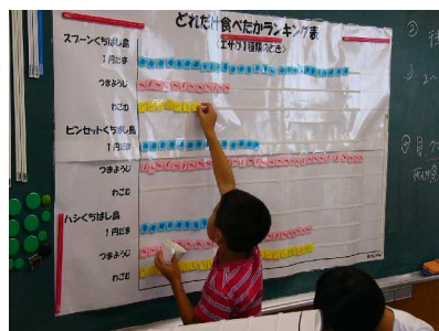
どんなくちばしで どんなエサがとれたかな??