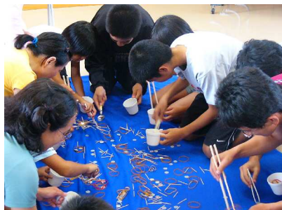
いろいろなくちばしで エサをついばむ参加者たち