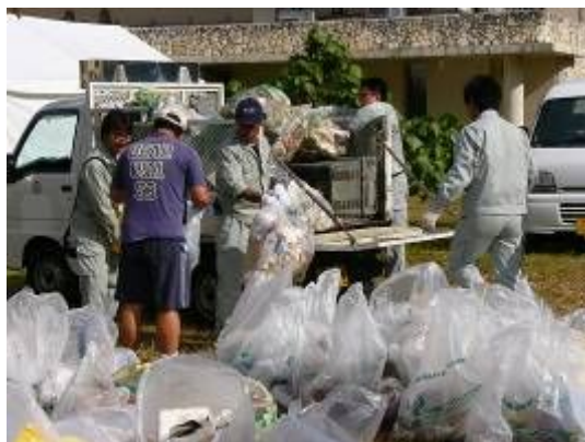
大型ゴミはじめ たくさんのゴミが…。

去る12月13日(土)、国場川流域7市町村主催による「第13回国場川水あしび」が開催されました。この催しは、地域の方々や、広く県民が国場川に親しみ、国場川の水辺環境について理解を深めてもらおうと、毎年行われています。