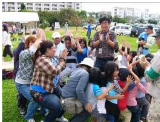
ゴミ拾いの後のお楽しみ?!

ゴミ拾いの後、おいしいカンダバーシュウシーを頂きました。その後、Mr.スティーブさんによる歌、ピエロさんによるバルーンアートもあり、楽しいひと時を過ごしました。皆さん、お疲れ様でした。