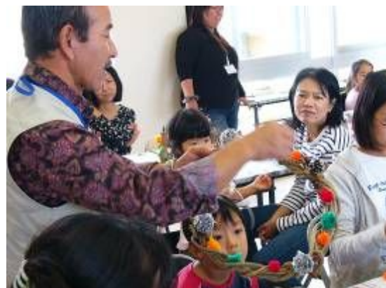
素敵なリースができましたね!

最後に、講師の先生から、ひとつひとつの作品にコメントをいただき、和やかな雰囲気の中で講座は終わりました。