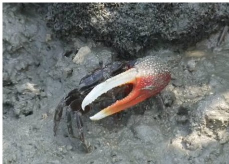
ヤエヤマシオマネキ