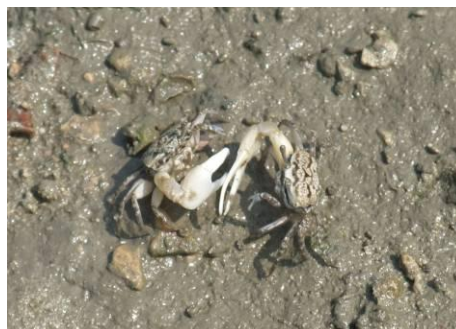
オキナワハクセンシオマネキ