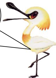
クロツラヘラサギ のクロン君